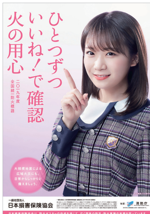
【2019年度全国統一防火ポスター】